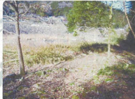
▲川辺沿いの広場が開かれ、川を眺められるようになりました。