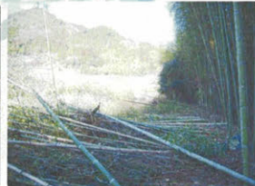
▲川辺沿いの竹伐採により、川沿いに歩ける通路ができました。