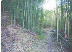
▲伐採により、川辺へ向かう通路が開かれました。