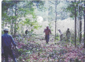
▲竹以外の樹木を残しながら、繁茂した竹を伐採しました。