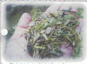
▲敷き材となる竹チップ