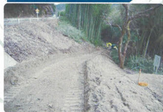
▲県道から川辺方向の通路へ